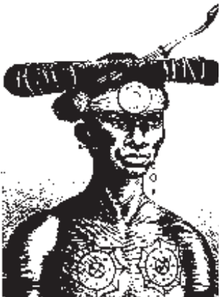
Tête d'Arfakis, extrait de H. Coupin, op.cit.